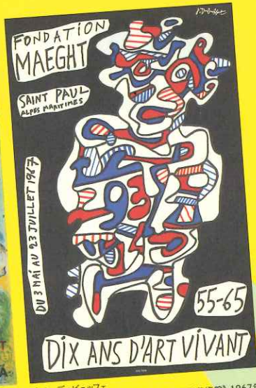
ジャン・デュビュフエ 《「生きている芸術10年記念」展、マエグ財団美術館》1967年 B0836