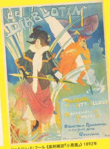
ジョルジュ・ド・フル《風刺雑誌「小悪魔」》1892年