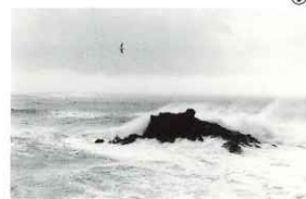
①《安室奈美恵》CD「SWEET 19 BLUES」1996年 ②《サンゴマスター》CD「サンゴマスターは君に語りかける」2005年 ③1992年 (MOTOR DRIVE)より ④2000年 (Hi-Bi)より ⑤2019年 (平間写真館TOKYO)より ⑥《盤龍神社、宮城県》2007年 田中浜(場踊り)より ⑦《宮城県七ヶ浜》2010年 (光景)より