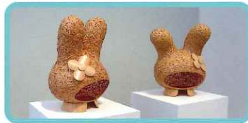
▲中臣 一 (マイメロディの面影)

本展のシンボルアート、増田セバスチャン氏の《Unforgettable Tower》がみなさまを最初にお出迎え!新進気鋭のアーティストたちによる、キャラクターとのコラボレーション作品も登場します。